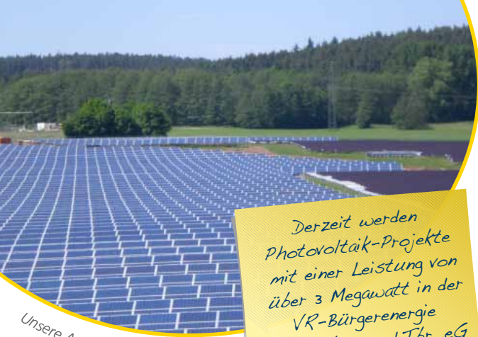
Unsere Anlage in Wiedersbach. Leistung: 198 kWp

Derzeit werden Photovoltaik-Projekte mit einer Leistung von über 3 Megawatt in der VR-Bürgerenergie Rothenburg o.d.Tbr. eG projektiert!