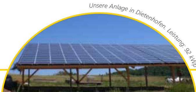
Unsere Anlage in Dietenhofen. Leistung: 92 kWp